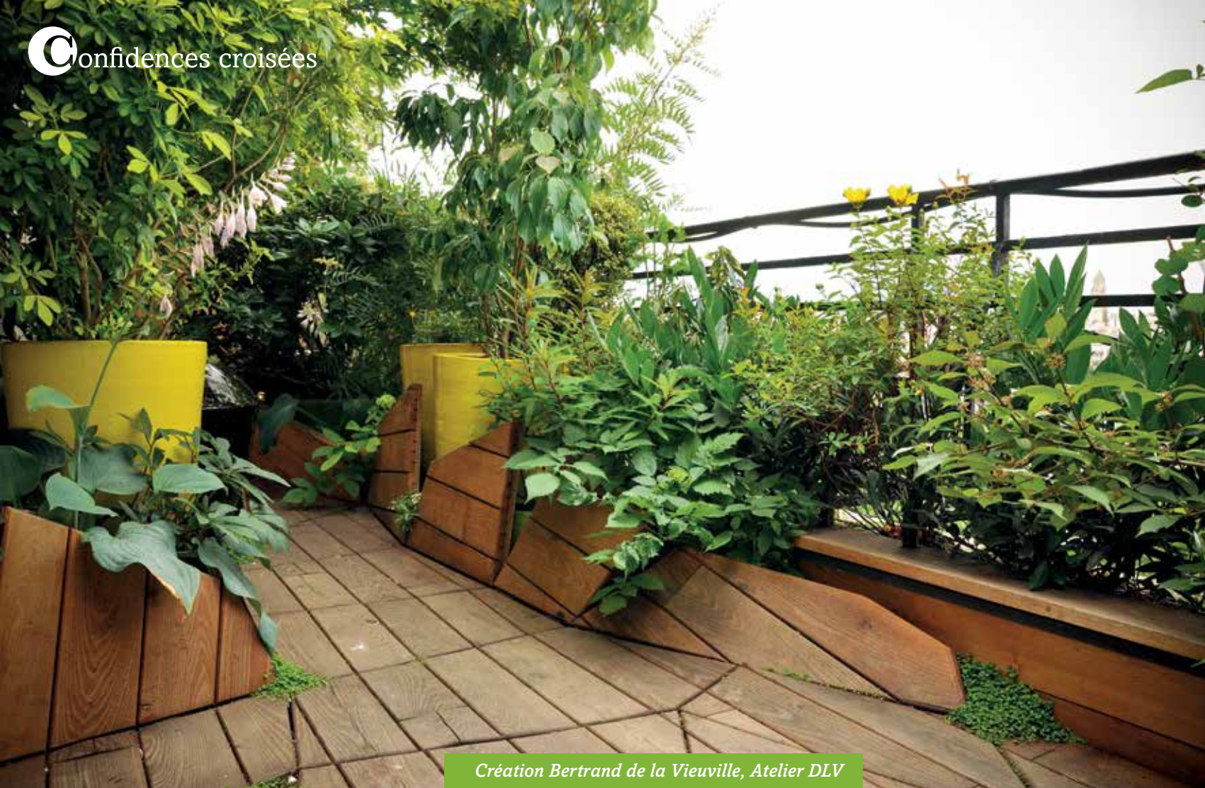
Création Bertrand de la Vieuville, Atelier DLV